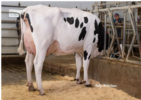
PROGENESIS TOPNOTCH MACIE GRANDDAM